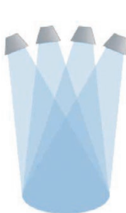
従来型の LED ライト

LED 素子が灯体中央部に配置されると、外科医の頭や手で光が簡単に遮断されてしまいます。しかし、SLX サージカルライトは、LED 素子の設計に配慮し、影を制御する技術により均一な光を発することで被写界深度を向上させています。