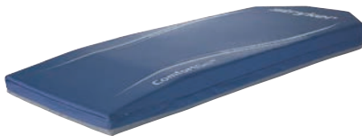
コンフォートゲル SE