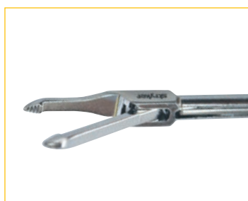
スーチャーグラスパー