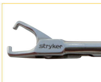
スーチャーマニピュレーター