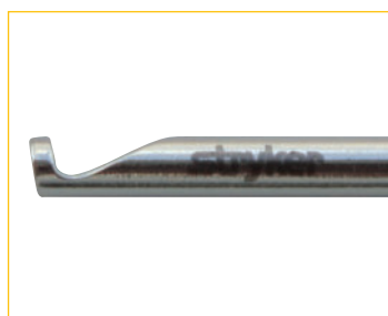
ノットプッシャー