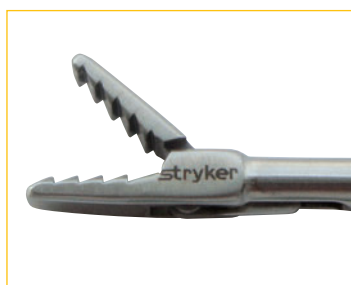
軟組織把持鉗子 (ラチェット付)