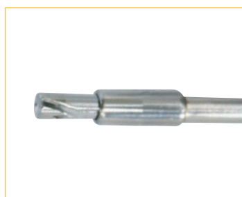
スーチャーカッター